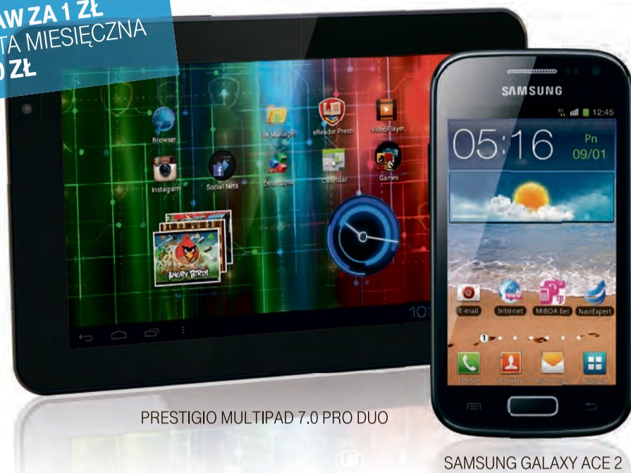
PRESTIGIO MULTIPAD 7.0 PRO DUO

ZESTAW ZA 1 ZŁ OPŁATA MIESIĘCZNA 64,90 ZŁ